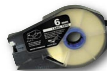
Štítková páska samolepící Identifikační pásek Obmotávací páska