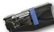
Navádění bužírky (v ceně přístroje)