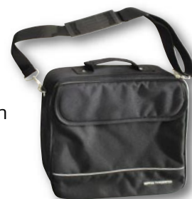
Možnost zakoupení praktického kufříku